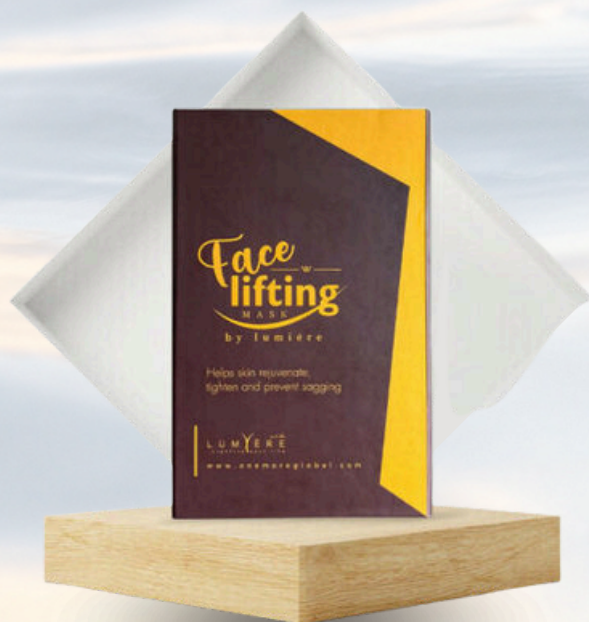
1 boîte de 3 masques